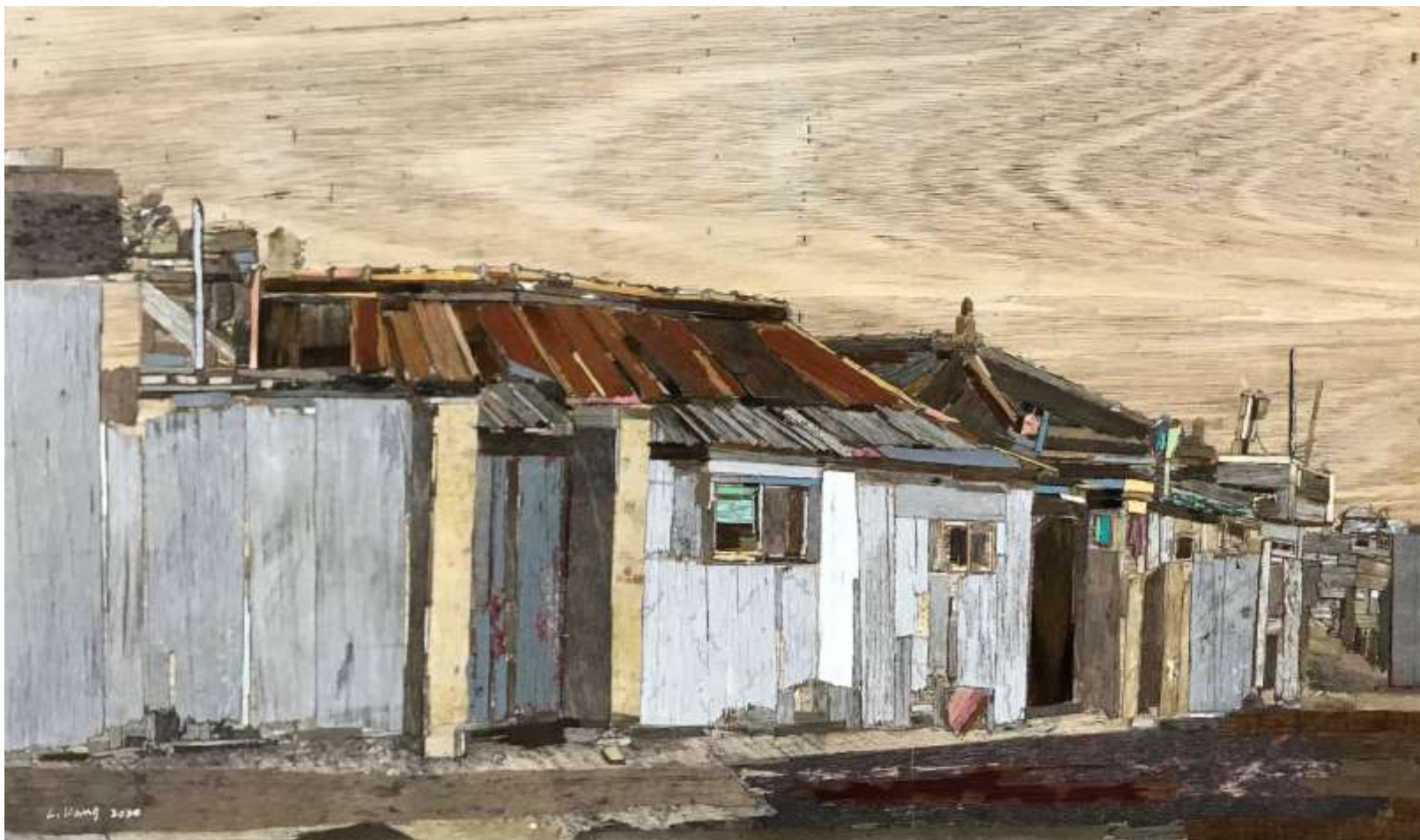
moved landscape(인계동4)_ 50X86cm_mixed media_2020