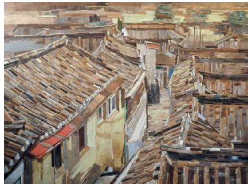
Trace layers16_ 112X146cm_mixed media_2016