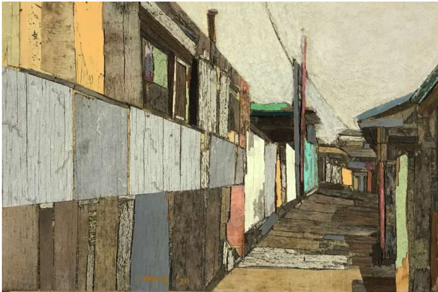
moved landscape(인계동3)_ 20X30cm_mixed media_2020