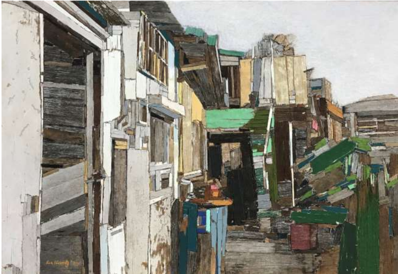
moved landscape G_ 36.5x53cm_mixed media_2020