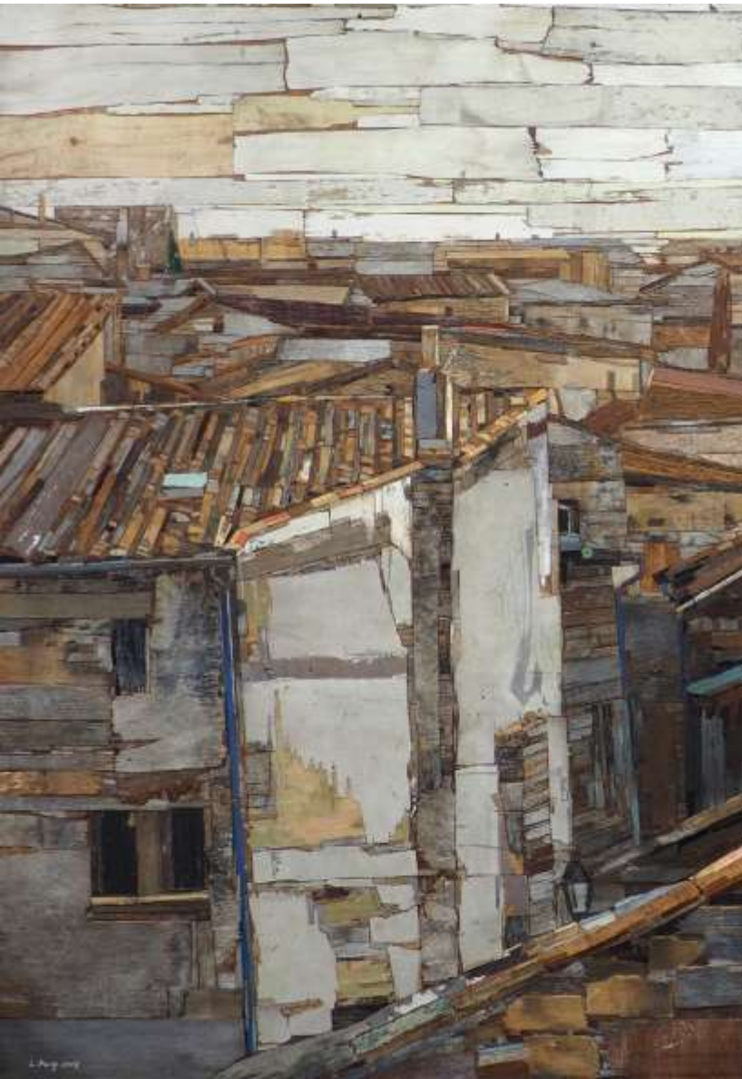
moved landscape_112x162cm_mixed media_2017