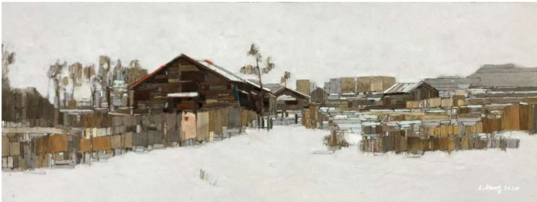
moved landscape(소금창고17)_ 30X80cm_mixed media_2020