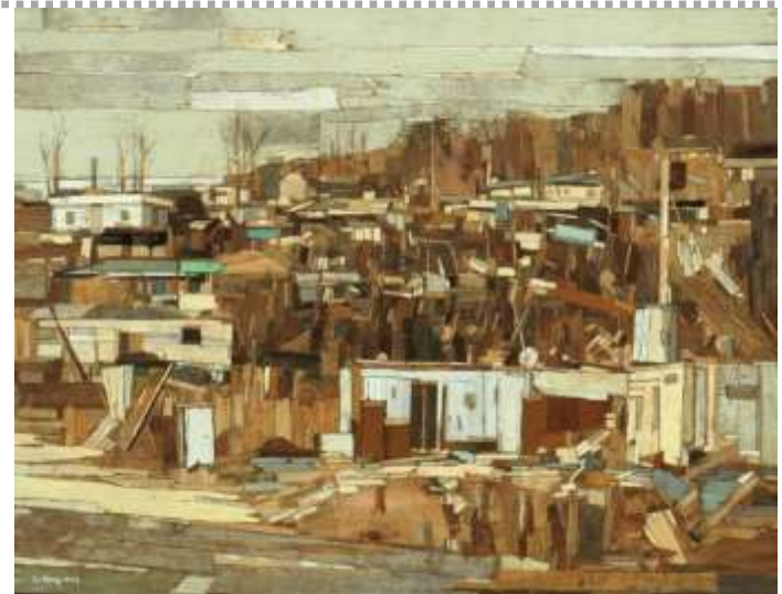
trace l23_61X91cm_ mixed media_2017