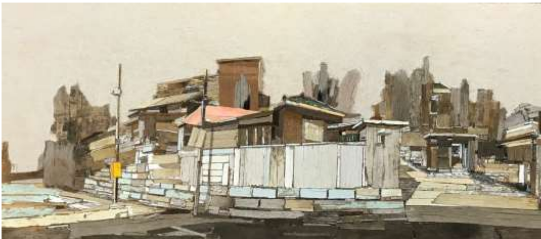
moved landscape(인계동1)_ 35X81cm_mixed media_2020