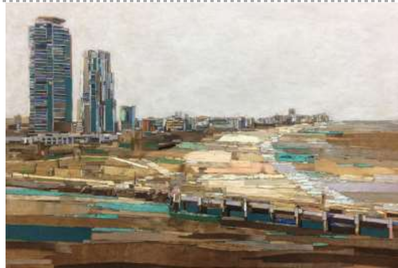
trace Miami_80.5x117cm_mixed media_2019