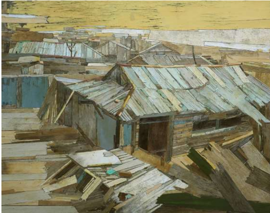
moved landscape 230_ 80x100cm_mixed media_2017