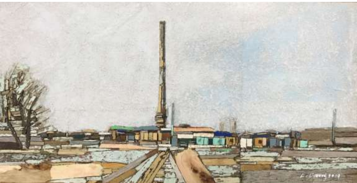
Trace 887-7_ 20X40cm_mixed media_2019