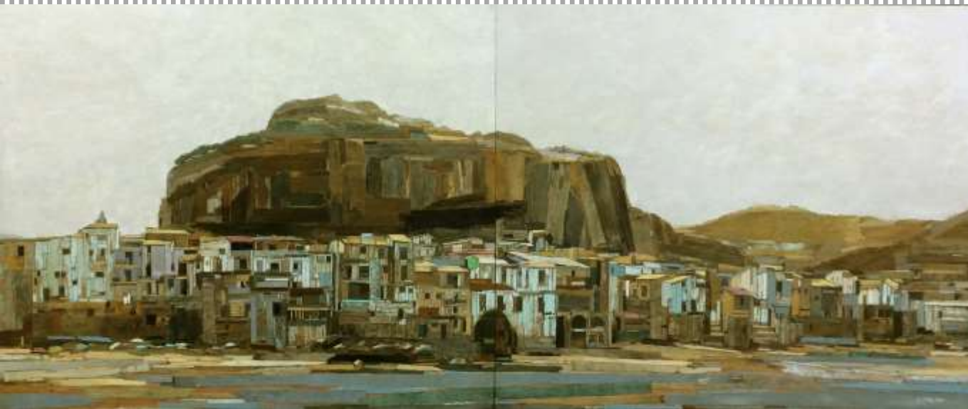
trace landscape-시질리아_103X244cm_mixed media_2018