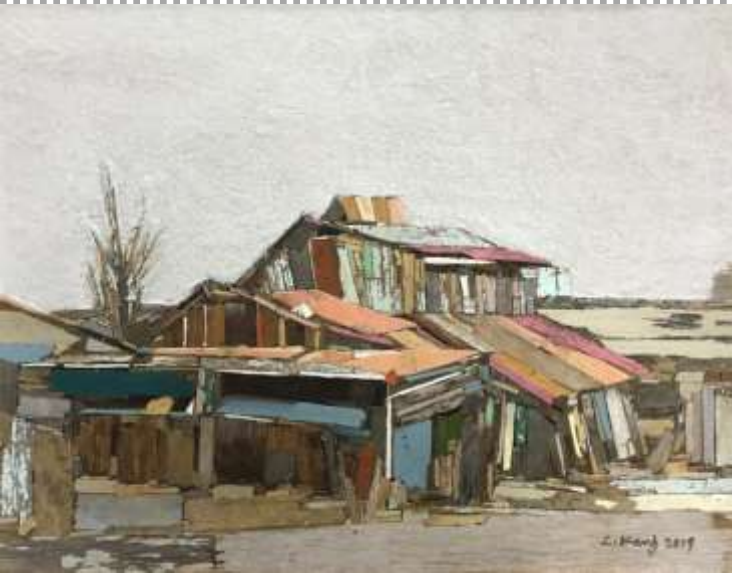
moved landscape _40x52cm_mixed media_2019