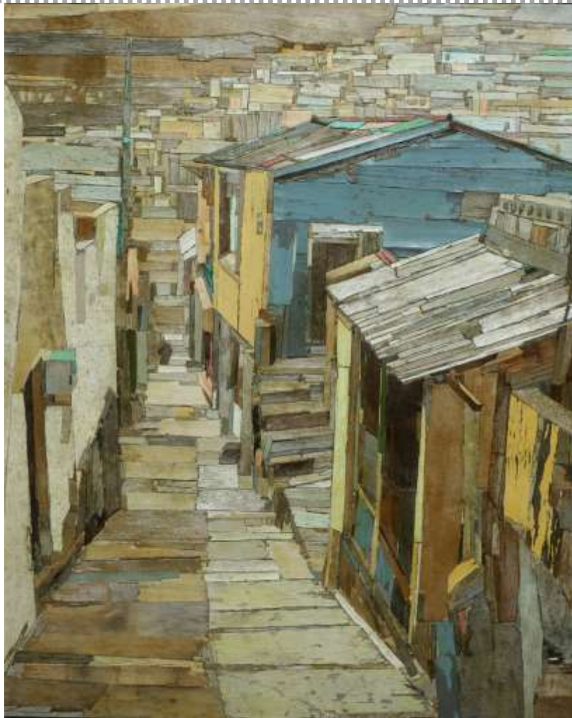
moved landscape G_ 91x73cm_mixed media_2017