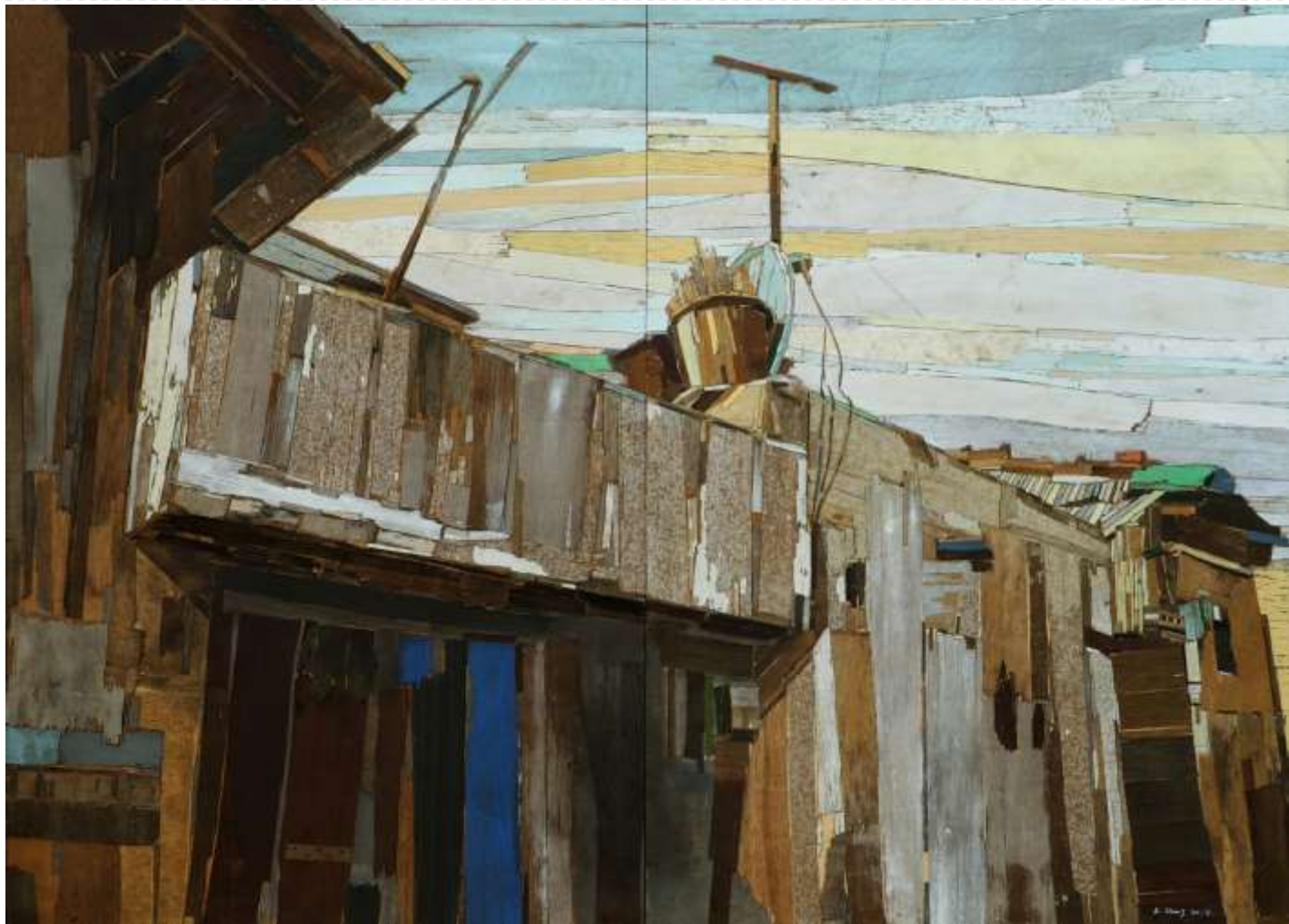
trace 307_ 117X162cm_mixed media_2017