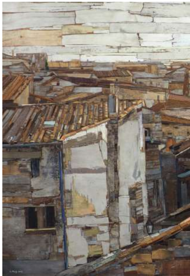
moved landscape_mixed media_162X112cm_2017