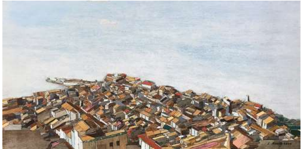
trace landscape-시칠리아3_30X60cm_mixed media_2020