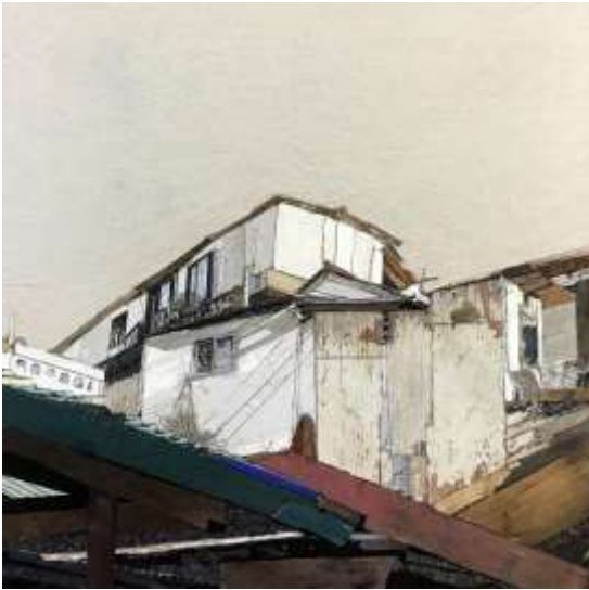
moved landscape (지동)_50x50cm_mixed media_2020