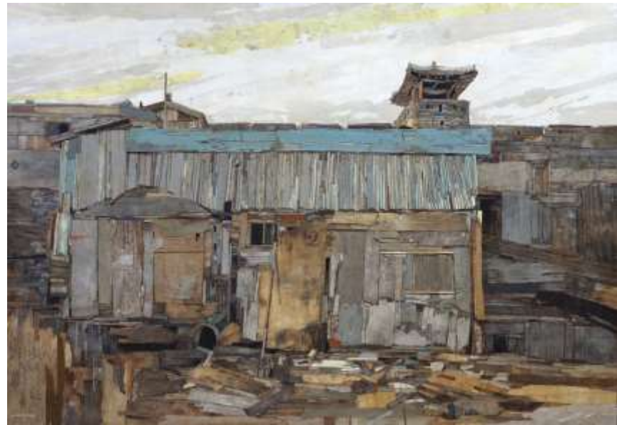
Trace 35_ 112X162cm_mixed media_2017