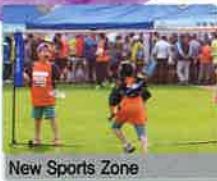
New Sports Zone